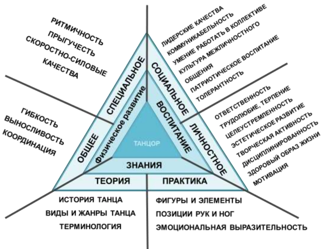
Перспектива развития танцора Рисунок 1

Каждая часть модели включает в себя теоретическое описание темы, варианты диагностик и способы фиксации диагностики, а также рекомендации по их применению. В приложении также представлены собранные нами диагностические карты и критерии оценки.